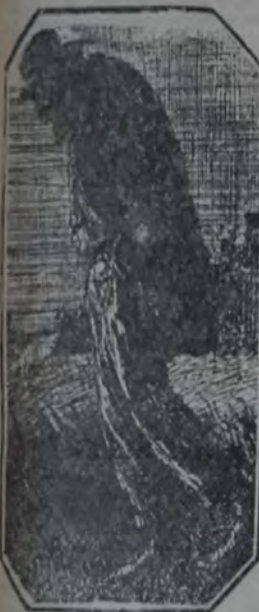
El mendigo siguió su camino lentamente

de su pesada carga del atolladero de conseguir adelantar nada, más se dobló las patas en el esfuerzo.