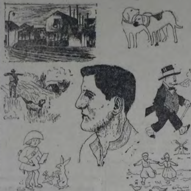
ARRIBA: RINCÓN DEL SUBURBIO, POR OSCAR ESPECIALI. MIS PERROS, POR CHICHITA ALFÉREZ. AL CENTRO: CAZANDO, POR J. PIGOZZI, TARASCONE, POR JOSÉ HUNT, TRIFÓN, POR A. F. USCO. ABAJO: EL CONJITO, POR ADELA PÉREZ. NIÑOS HOLANDESSES, POR LUISA PÉREZ

—Si llamo de nuevo — se dijo — es capaz de tirar, y si grita, todo el pueblo saldrá a insultarme y a apedrearme.