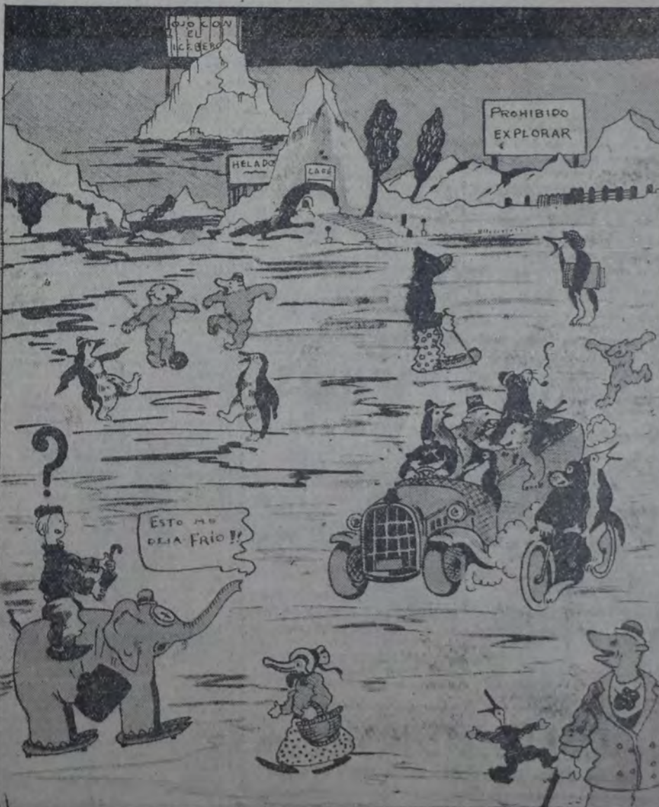
CUCHARITA, NUESTRO HEROE SEMANAL, PARTE DEL CONGO, SIGUIENDO LA PISTA DE NOBILE EL "héroe fugitivo" y he aquí cómo su visión polar se ve defraudada